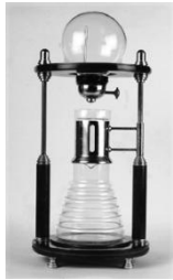
(A)虹吸式咖啡煮具 (B)冷水滴漏式咖啡沖泡器 (C)美式咖啡機 (D)摩卡壺。